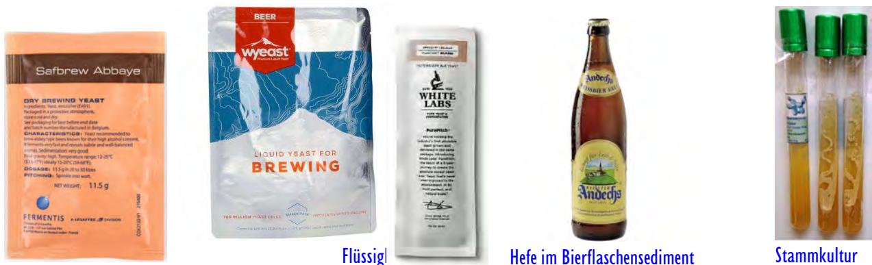
Abb. 1. Trockenhefe

Eine zweite einfachere Strategie ist die Zufuhr einer hohen Zahl an Wunsch-Bierhefen, die unter günstigen Wachstumsbedingungen die Zahl der ebenfalls sich vermehrenden Fremdhefen und Bakterien durch eine rasche Hauptgärung bei weitem überkompensiert und letztere sogar durch die entstehenden End- und Nebenprodukte wie Ethanol, Kohlenstoffdioxid CO 2 im Schach hält.